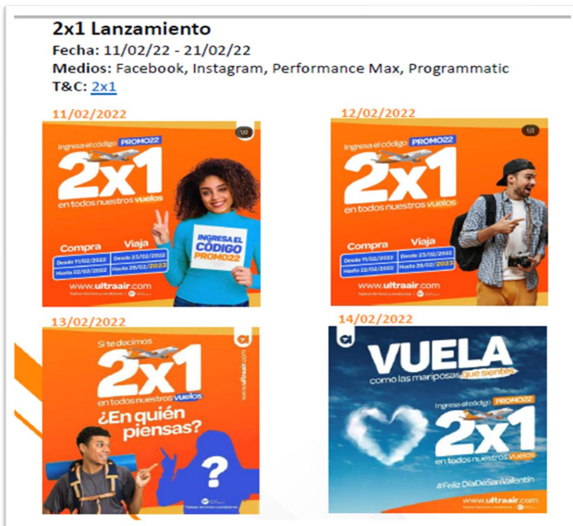
Imagen No. 3: Tomada de la respuesta de Ultra Air "Anexo 1_CampañasPublicitarias (003)", del radicado 20225340592472

Por la cual se inicia una investigación administrativa mediante la formulación de pliego de cargos en contra de la sociedad Ultra Air S.A.S.