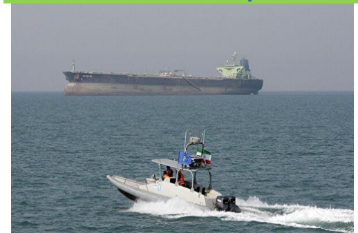
Figura 3: Servicios prestados a la nave