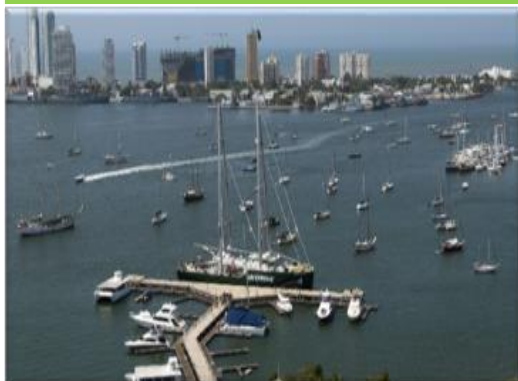
Figura 2: Canal de acceso

Mediante el canal publico se tiene acceso maritimo a la Sociedad Portuaria