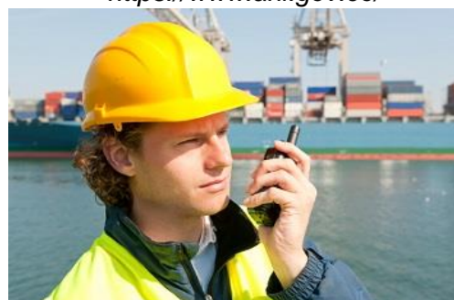
Figura 7: Equipos