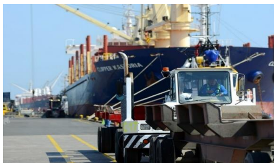
Figura 6: Equipamiento