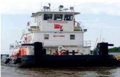
Figura 7 Muelle