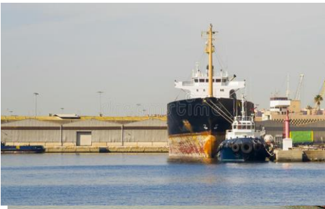
Figura 3: servicios prestados a la nave