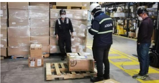
Figura 5: Reconocimiento de carga

Manipulación y transporte de mercancías Cargue/Descargue/Transbordo Estiba/Desestiba Reconocimiento e inspección de mercancía Servicio a los contenedores Clasificación y toma de muestra Manejo y reubicación Embalaje y reembalaje Pesaje y cubicaje Marcación y rotulación Almacenaje de mercancías Consolidación y desconsolidación de mercancías