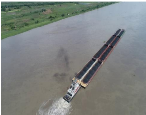
Figura 2: Canal de acceso