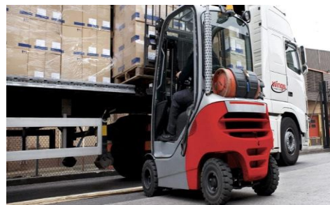
Figura 6: Manipulación y transporte de mercancías