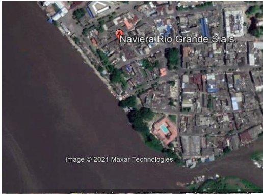
Figura 1: vista en planta del puerto