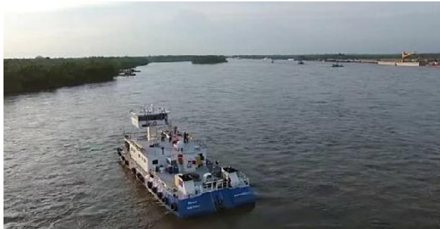
Canal de acceso Impala Terminals Archivo Impala Terminals Barrancabermeja