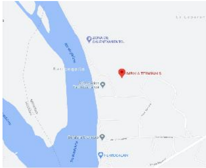
vista en planta del puerto. Extraída de Google Earth