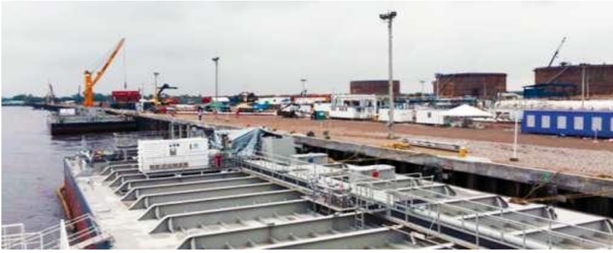
Operación en Muelle Impala Terminals