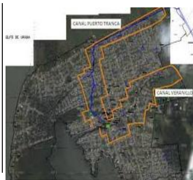
Figura 1: Vista en planta del puerto.