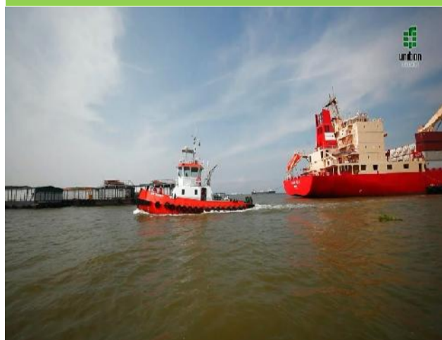
Figra 2: Canal de acceso