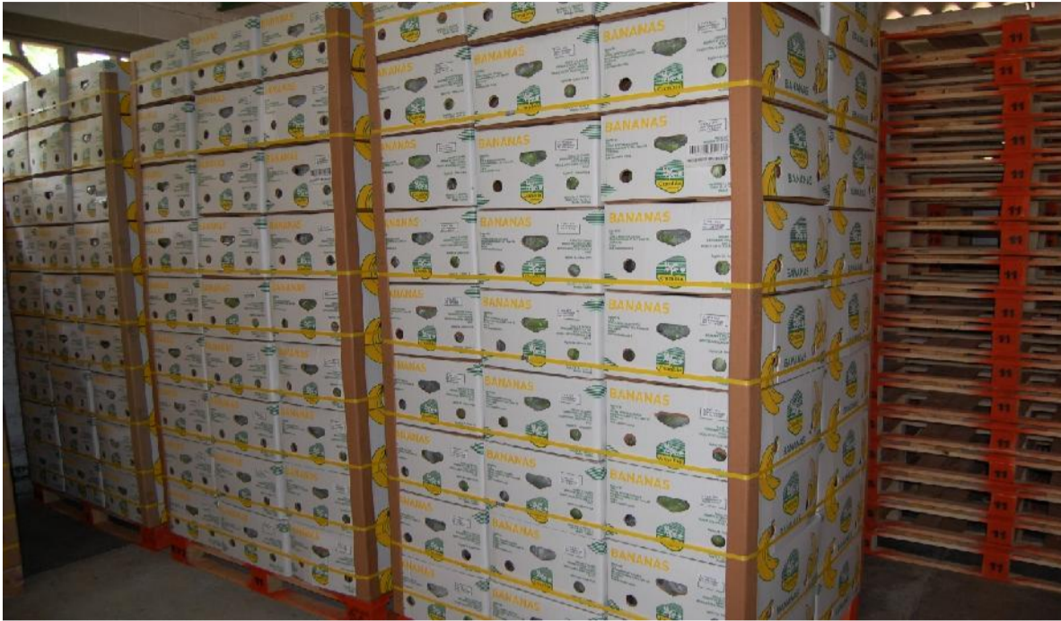
Figra 4: Bodega