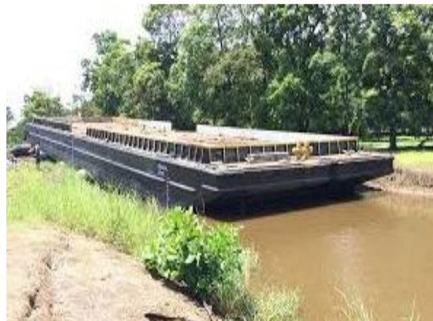
Figra 5: Barcaza