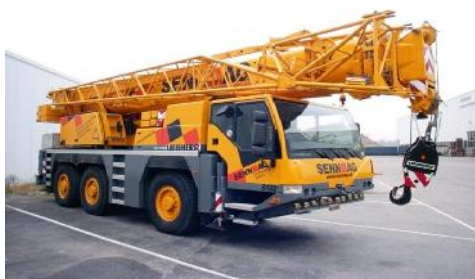
Figura 6: equipamiento de Cenit