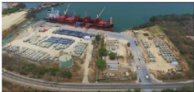
Figura 5: vista aérea de muelle

El muelle de la sociedad portuaria del Dique S.A tiene una 120m de longitud, aproche de 35 metros de ancho, resistencia de losa de 3.000 P.S.I profundidad de 26 pies, con bitas de amarre cada 10metros a lo largo del muelle.