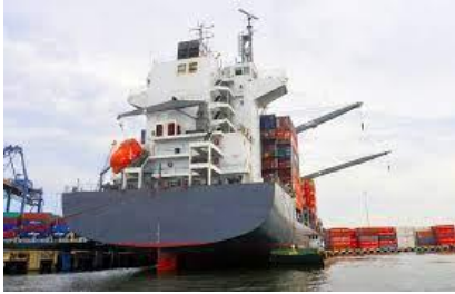
Figura 3: servicios prestados a la nave