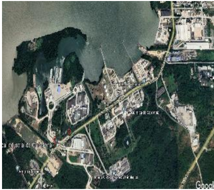
Figura 1: vista en planta del puerto