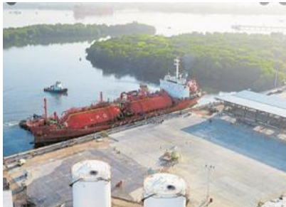
Figura 2: canal de acceso