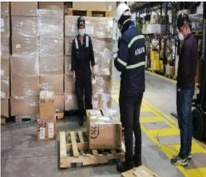
Figura 4: servicios prestados a la carga