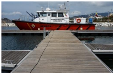
Figura 6: Muelle Imagen de referencia

El proyecto consta de una estructura contención tipo tablestaca en la costa del lote mencionado cuya longitud es de 39,00m aproximadamente. La tablestaca se proyectará para poder rellenar parte del lote erosionado y proyectar un muelle para el atraque de barcas. La altura del relleno y la tablestaca es de 2,00 por encima del nivel del mar