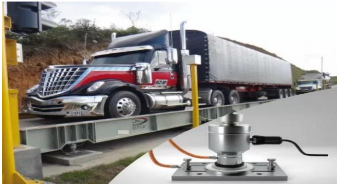
Figura 7: equipamiento de Terminal de IFO'S