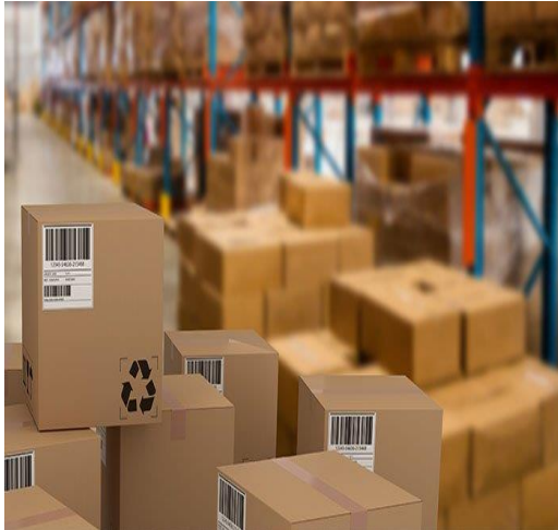
Figura 4: servicios prestados a la carga

Manipulación y transporte de mercancías. Cargue/Descargue/Transbordo. Estiba/Desestiba Clasificación y toma de muestras Reconocimiento o inspección de mercancías Trimado/Trincado/Tarja. Manejo y reubicación Embalaje y reembalaje. Pesaje/Cubicaje. Marcación y rutulación. Almacenaje de mercancías Porteo a la carga Consolidación o desconsolidación de mercancías Cadena de frío. Servicio a los contenedores.