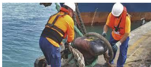
Figura 3: servicios prestados a la nave

Servicio de practicaje Servicio de remolcador. Amarre y desamarre de buques. Muellaje Apertura de escotilla Acondicionamiento de rúas, plumas y aparejos. Aprovisionamiento y usería. Recibo y/o suministro de lastre. Suministro de combustible. Servicios de lancha. Recepción de desechos líquidos y vertimientos. Recepción de desechos sólidos Servicio de vigilancia Servicios públicos. Suministro de agua potable Electricidad. Fumigaciones Reparaciones menores