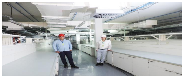
Figura 5: Instalaciones

Muelle Bodegas. Pacios de almacenamiento Pacios multiproposito Zona administrativa Puerto de entrada