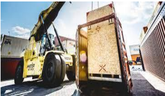
Figura 4: servicios prestados a la carga

Manejo y Reubicación. Trimado. Trincado. Tarja. Cargue/Descargue/Transbordo. Manipulación de mercancías.