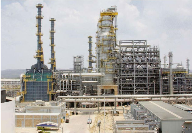
Figura 6: equipamiento Refinería de Cartagena