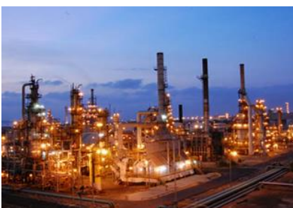
Figura 6: vista aérea de la refinería de cartagena

El muelle "Roll Off", se encuentra localizado sobre una darsena natural al costado sur de las instalaciones de la refinería de Cartagena, Este muelle esta diseñado para el manejo y atención de barcazas con dimensiones de 76,2mx 22m. Tiene una capacidad de aporte de 10 ton/m 2 . Tiene una longitud de 140m por 31 de ancho. En el se reciben elementos extrapesados y/o extradimensionados, con dimensiones hasta de 12m de ancho y con pesos de hasta 1.000 toneladas métricas