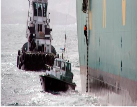
Figura 3: servicios prestados a la nave