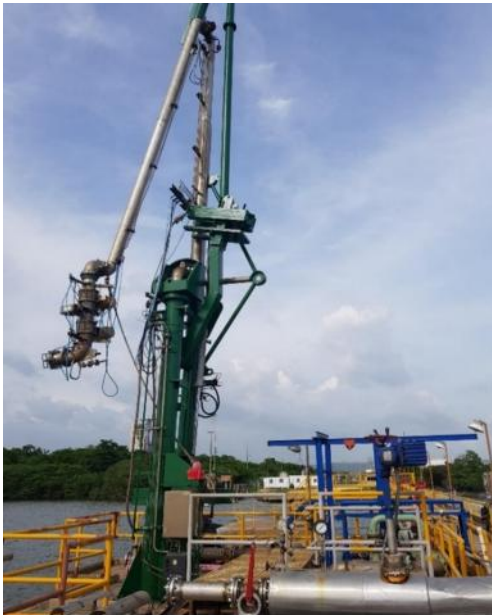
Figura 7: brazo de carga