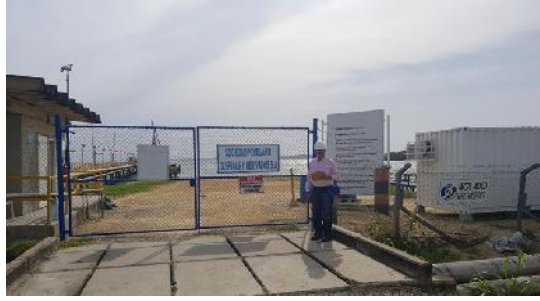
Figura 5: instalaciones de olefinas y derivados

Por la naturaleza del producto, solo se cuenta con tuberías: