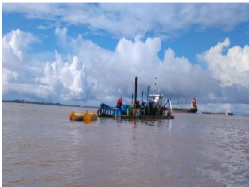
Figura 2: canal de acceso