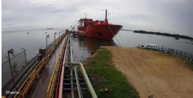
Figura 3: servicios prestados a la nave