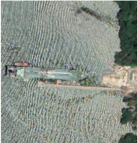
Figura 1: vista en planta del puerto extraída de Google Earth