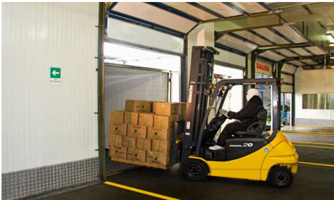
Figura 3: servicios prestados a la nave

Muellaje Cargue y descargue Transbordo Trasciego Características del buque y diseño. Servicio de practicaje. Supervisión del servicio Servicio de remolcador. Servicio de muellaje. Suministro de agua dulce.