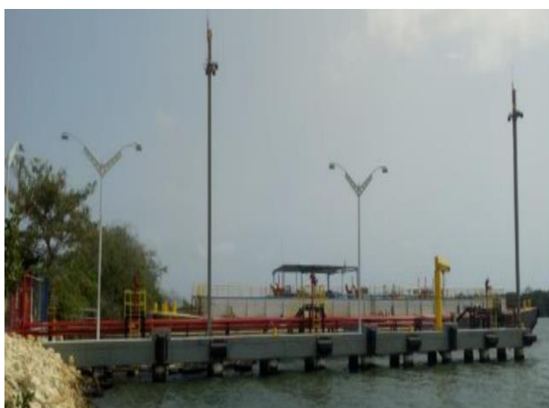
Figura 2: Canal de acceso