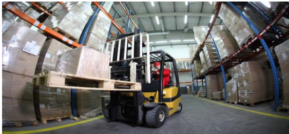
Figura 4: servicios prestados a la carga