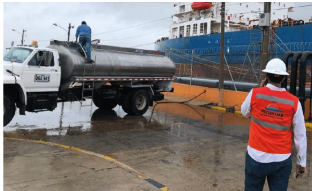
Figura 4: Suministro de agua dulce