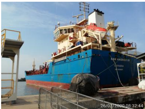
Figura 2: Canal de acceso