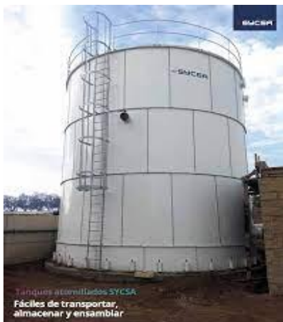
Figura 4: Tanques para almacenamiento

La instalación portuaria cuenta con dos tanques para recepción de aceite sucios con capacidad de 1.500 galones y 365 galones respectivamente.