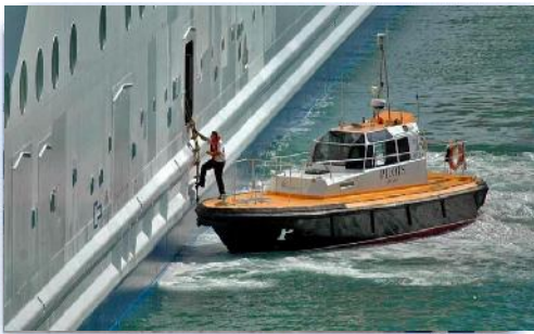
Figura 3: servicios prestados a la nave