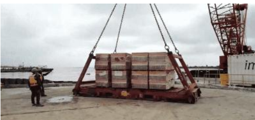
Figura 6: Muelle

El Terminal cuenta con un muelle marginal de concreto para embarcaciones mayores, con longitud de 50 metros, ancho 5 metros, con 2 plataformas de acceso de 8 metros de largo por 5 metros de ancho. Esta construido de concreto armado sobre 13 de tablestacas de 0,35 x 0,35 metros, largo 10.5 metros, 13 pilotes de tracción de 0,35 x0,35 metros, vigas de amarre de 0,4 x 0,5 metros y cubierta de placa de concreto de 0,20metros.