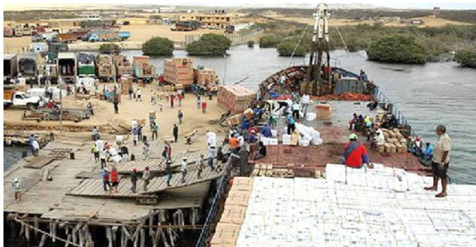
Figura 4: Muelles