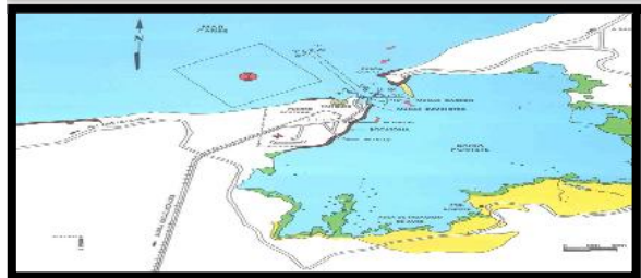
Figura 1: Vista en planta del puerto.