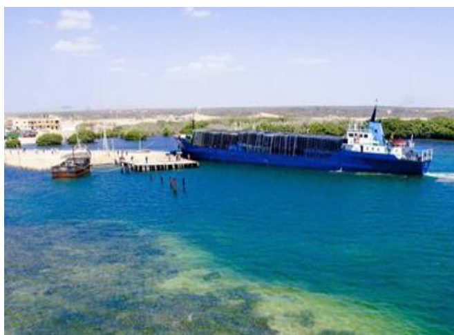
Figura 2: canal de acceso

Longitud (millas) 380 Profundidad (m) 5 Calado de operación (m) 0.3