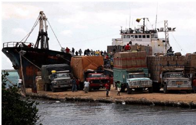
Figura 3: Servicios prestados a la nave