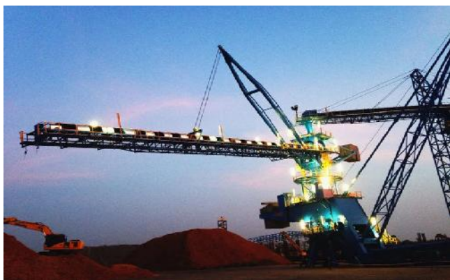
Figura 7: Apilador-reclamador