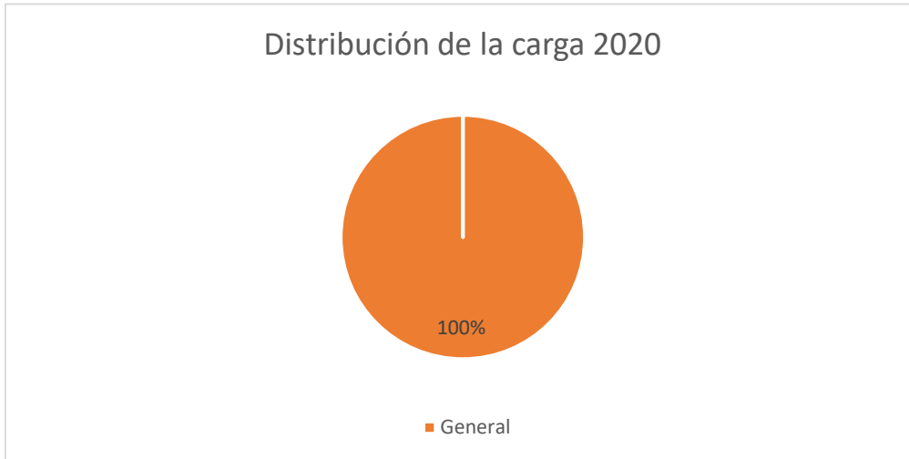
Figura 9: Distribución de la carga 2020