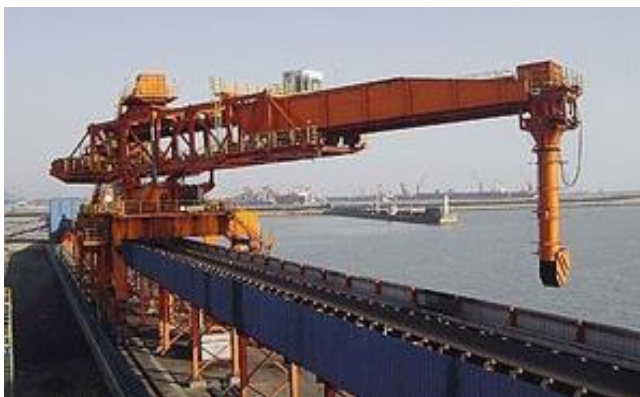
Figura 8: Cargador de buque