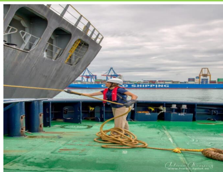
Figura 4: Servicio a las motonaves

Servicio de Amarre y Desamarre de Buques Muellaje Apertura Escotilla Acondicionamiento de grúas, plumas y aparejos Reparaciones menores Aprovisionamiento y Useria. Fumigación Remolcador Atraque y desatraque Otros