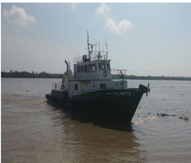
Figura 2: Canal de acceso

El canal de acceso al Terminal de Instalaciones de la Sociedad Portuaria AQUAMAR S.A., es el canal navegable fluvial del Río Magdalena