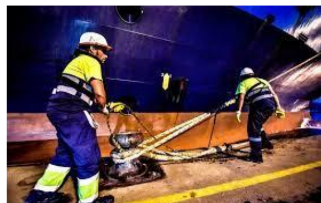
Figura 3: servicios prestados a la nave