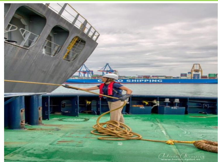
Figura 4: Servicio a las motonaves

Servicio de Amarre y Desamarre de Buques Muellaje Apertura Escotilla Acondicionamiento de grúas, plumas y aparejos Reparaciones menores Aprovisionamiento y Useria. Fumigación Remolcador Atrache y desatrache Otros