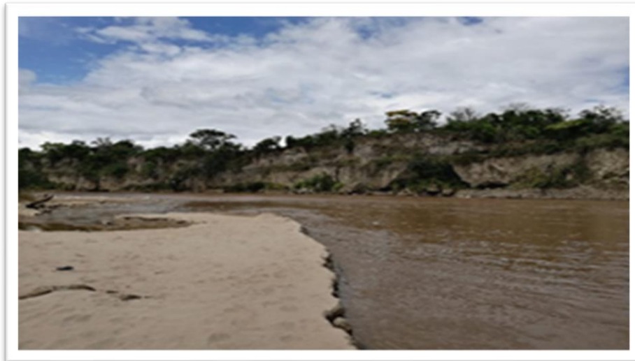
Ilustración 13. Zona de embarque Muelle la Cañada