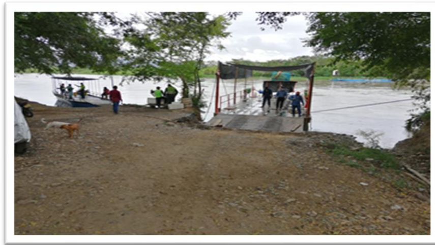
Ilustración 3. Embarcadero El Pata

con la prestación del servicio de transporte fluvial por parte de una persona natural y la empresa TRANSPORTE FLUVIAL OYOLA EMPRESA ASOCIATIVA DE TRABAJO.