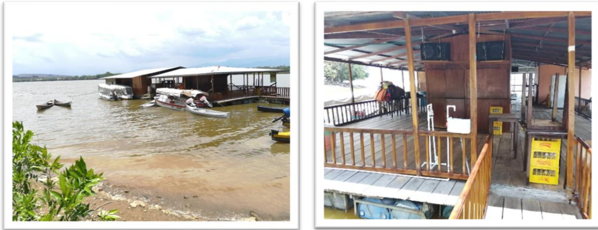
Ilustración 16. Muelle de Yaguará