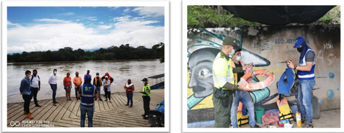
Ilustración 7 Verificación de la operación fluvial