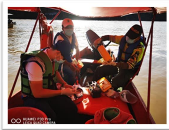
Ilustración 2. Verificación protocolo de bioseguridad empresa Navitur