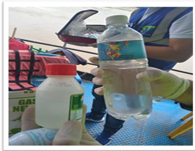
Ilustración 5. Elementos de seguridad vencidos empresa de Transporte Fluvial Oyola Empresa Asociativa de Trabajo.