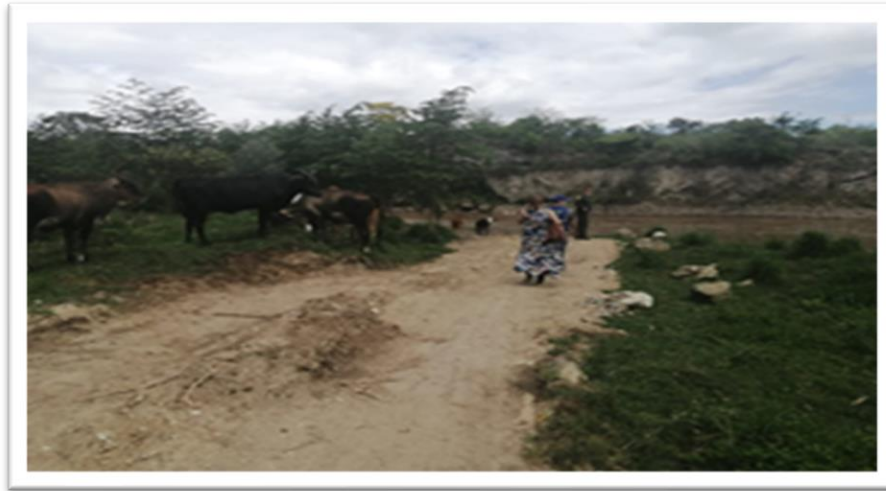
Ilustración 14. Vía de acceso Muelle la Cañada