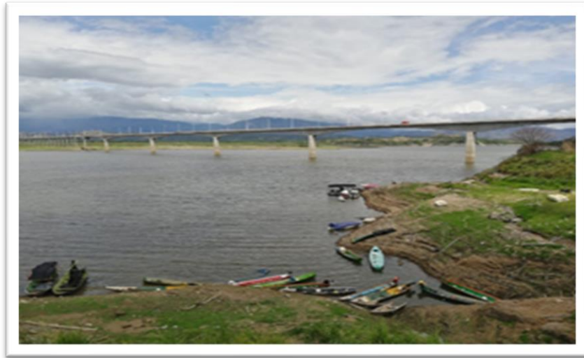
Ilustración 8. Embarcadero el Balseadero

Por otra parte, fue informado que en el Plan Básico de Ordenamiento Territorial - PBOT del 2021 se verán reflejados los puntos estratégicos donde la empresa EMGESA construirá los muelles con los que se comprometió cuando iniciaron la construcción de la hidroeléctrica, no obstante, el lugar en donde está ubicado este embarcadero no está contemplado para este fin en el PBOT por ser zona de alto riesgo.