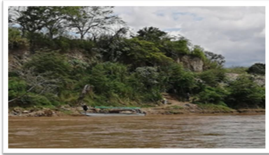
Ilustración 12. Muelle la Cañada