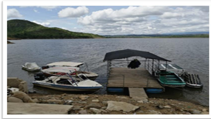
Ilustración 10. Zona de embarque informal