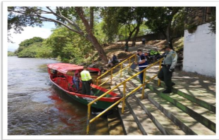
Ilustración 1. Muelle la Gaitana

Adicional a lo señalado, en el Muelle la Gaitana operan otras cuatro (4) embarcaciones identificadas como La Piragua con número de patente 11220187, La Picuda con número de patente 11220186; La Arawana con número de patente 11220191 y La Pinta con número de la patente 11220190, las cuales no están vinculadas en ninguna de las empresas que operan en el sitio, no obstante, fue informado por el representante legal de la empresa ASOFLUVIAL, que los propietarios de las cuatro (4) embarcaciones se encuentran en un proceso muy adelantado para su vinculación en esta organización.