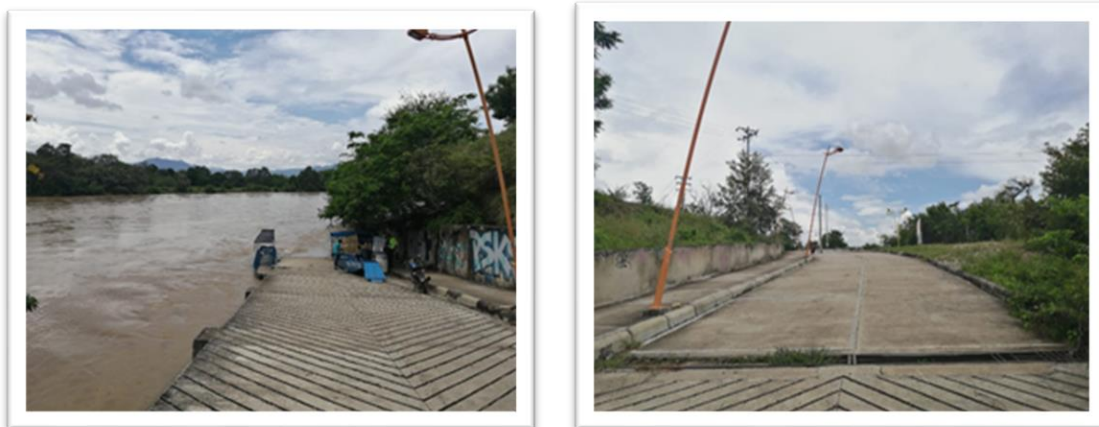
Ilustración 6. Muelle de Villavieja

En desarrollo de la caracterización fluvial realizada en el municipio de Villavieja por la Superintendencia de Transporte con el acompañamiento de la Alcaldía Municipal y la Policía Nacional, se identificó un muelle conocido comúnmente como Muelle de Villavieja, cuya infraestructura es tipo rampla de concreto y en el cual opera la empresa RIVER'S TOUR VILLAVIEJA EMPRESA ASOCIATIVA DE TRABAJO, identificada con NIT 901.120.005-1, la cual presta el servicio público de transporte fluvial de pasajeros en las modalidades pasajeros y turismo.