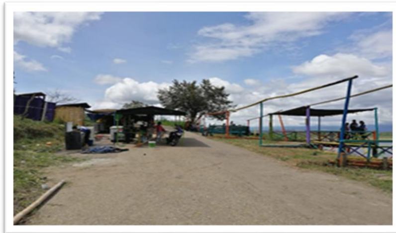
Ilustración 9. Vía de acceso al Embarcadero el Balseadero