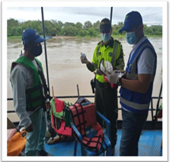
Ilustración 4. Verificación en embarcaciones