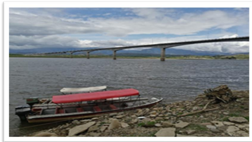
Ilustración 11. Embarcación informal