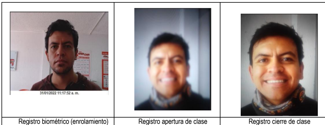
Imagen No. 5. Aprendiz identificado con Cédula de Ciudadanía No. 1.018.514.682 que simuló los movimientos exigidos por el reconocimiento facial con el fin de dar apertura y cierre a las clases prácticas del 15 de febrero de 2022 11 .

Imagen No. 4. Aprendiz identificado con Cédula de Ciudadanía No. 1.019.078.150 que simuló los movimientos exigidos por el reconocimiento facial con el fin de dar apertura y cierre a las clases prácticas del 15 de febrero de 2022 10 .