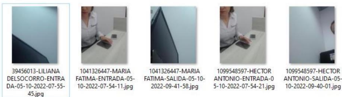
Imagen No. 2. Evidencias fotográficas que demuestran el uso indebido del reconocimiento facial con el fin de dar apertura y cierre a las clases teóricas del 5 de octubre de 2022.