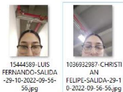
Imagen No. 4. Evidencias fotográficas que demuestran el uso indebido del reconocimiento facial con el fin de dar apertura y cierre a la clase práctica del 29 de octubre de 2022.

Frente a las anteriores irregularidades, el Consortio para CEAS y CIAS concluyó: