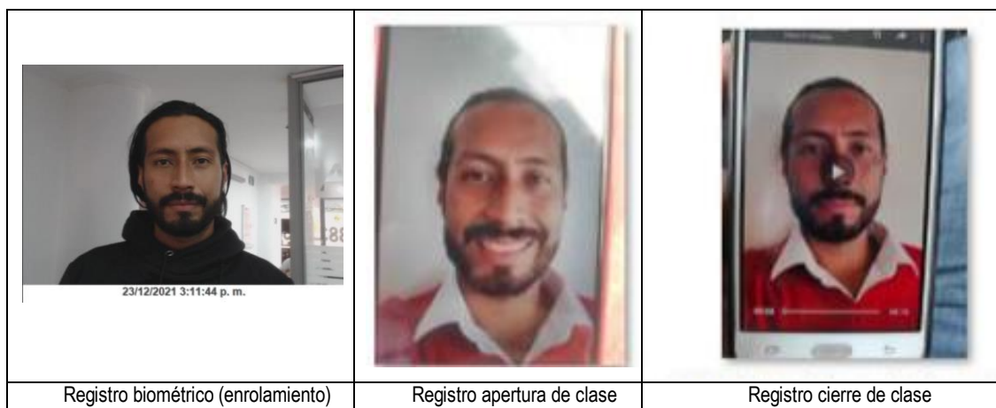
Imagen No. 4. Aprendiz que simuló los movimientos exigidos por el reconocimiento facial con el fin de dar apertura y cierre a las clases prácticas del 1 de febrero de 2022 10 .