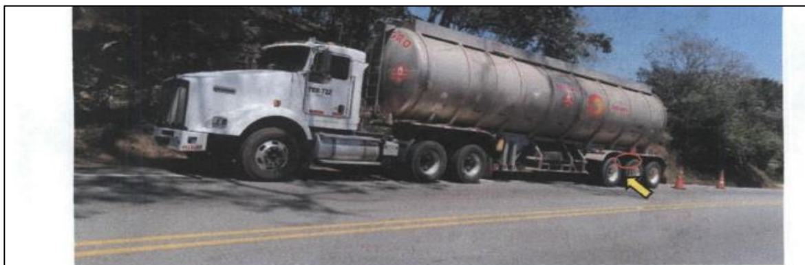
IMAGEN 1 plano general: Donde se observa el tractocamión de placas TRM 722 y se señala aproximación de la ubicación de la fisura mediante círculo rojo y flecha amarilla parte posterior del tanque y parte inferior del mismo, justo en el centro del tanque.

Así mismo, mediante oficio aclaratorio adjunto al IUIT, el agente de tránsito dejó registro fotográfico de la infracción, tal como se enseña a continuación: