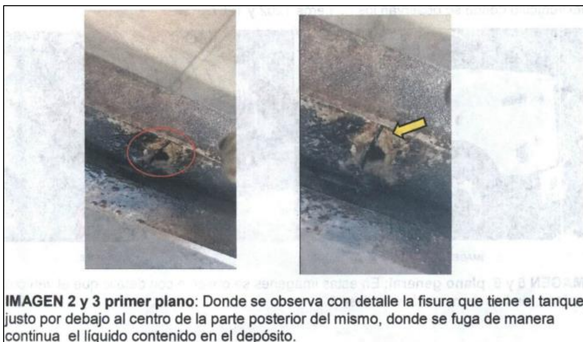
IMAGEN 2 y 3 primer plano: Donde se observa con detalle la fisura que tiene el tanque, justo por debajo al centro de la parte posterior del mismo, donde se fuga de manera continua el líquido contenido en el depósito.

Imagen No. 4 imagen del vehículo de placas TRM722 extraídas del informe aclaratorio adjunto al IUIT No. 82693