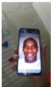
13578665 - Fotografia Tomada - 6