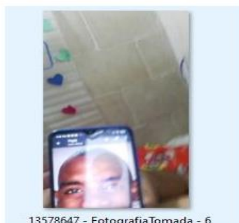
13578647 - Fotografia Tomada - 6

“Por la cual se abre una investigación administrativa mediante la formulación de pliego de cargos en contra el Centro de Enseñanza Automovilística ESCUELA DE CONDUCCIÓN YOMANEJO ”