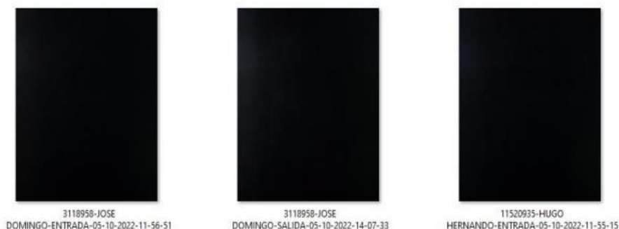
Imagen No. 2. Registro fotográfico del ingreso y salida de la clase de teoría impartida por CEA AUTOCETTT el día 05 de octubre del 2022 en el horario comprendido entre las 11:00 AM y la 1:00 PM

Así mismo, frente a la clase práctica impartida el día 11 de octubre de 2022, se allegó la siguiente información: