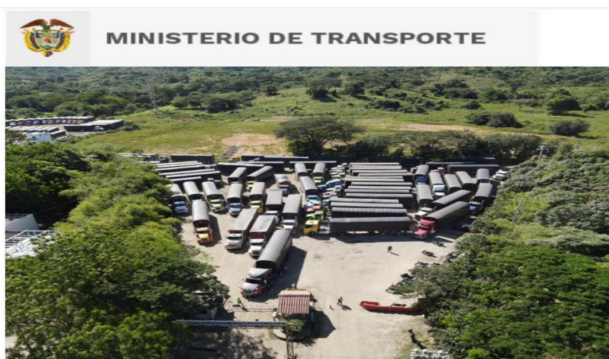
Imagen No. 2. Extraída del documento (...)

La facilitadora tiene conocimiento que el puerto y la Asamblea Nacional del Transporte en cabeza del señor Alejandro Quiroga se comunican tanto telefónicamente como por reunión virtual luego de haberlos puesto en contacto. En la reunión efectuada casi al finalizar la tarde participa el señor Alejandro Quiroga y representantes de Renacer Camionero, inicialmente de forma virtual, pero cuando el gerente del puerto se percata que varios de los que hablaban en la reunión virtual estaban afuera del puerto él se acercó a donde estaban. Abiertamente los manifestantes indicaron que para ellos los problemas del puerto son menores y que el objetivo es lograr el pago del stand by por las demoras en el descargue. Al finalizar la reunión, en la noche, Renacer Camionero hace llegar un pliego de peticiones al puerto