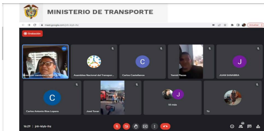
Imagen No. 4 Extraída del documento

Los dirigentes gremiales en representación de los transportadores expresan que en la reunión se revisaría solamente el punto del pliego de peticiones relacionado con el stand by porque el puerto ya se había comprometido con seguir llevando a cabo las mejoras necesarias para mejorar la operatividad en el descargue de los vehículos. Los generadores presentes en la reunión se manifiestan sobre el tema en particular y sugieren hacer la revisión en conjunto con las empresas de transporte en cuanto a los tiempos de operación de los vehículos para determinar el pago del stand by.