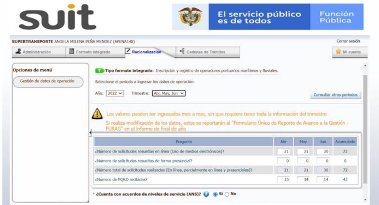
Imagen No. 4: Inscripción y registro de operadores portuarios, marítimos y fluviales.

La dependencia responsable del trámite es la Delegatura de Puertos de la Superintendencia de Transporte, se evidenciaron para el mes de abril 21 operaciones, para mayo 21 operaciones y para junio 30 operaciones, lo que coincide con la información reportada por la Oficina Asesora de Planeación en la carpeta Share Point – repositorio de evidencias – a. direccionamiento estratégico- b. AUDITORÍAS- B2 SEGUIMIENTO- 2. SUIT – Segundo trimestre, en la matriz denominada "OAP SUIT reporte II trimestre 2022"