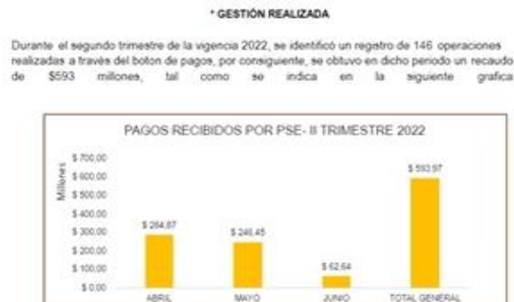
Imagen 3: Captura de Pantalla Tomada del Excel Reporte segundo Trimestre SUIT_CEV, correspondiente al segundo trimestre de 2022.

Vigilancia, evidenciando el monitoreo realizado a cada una de las transacciones realizadas, se describe el siguiente análisis: