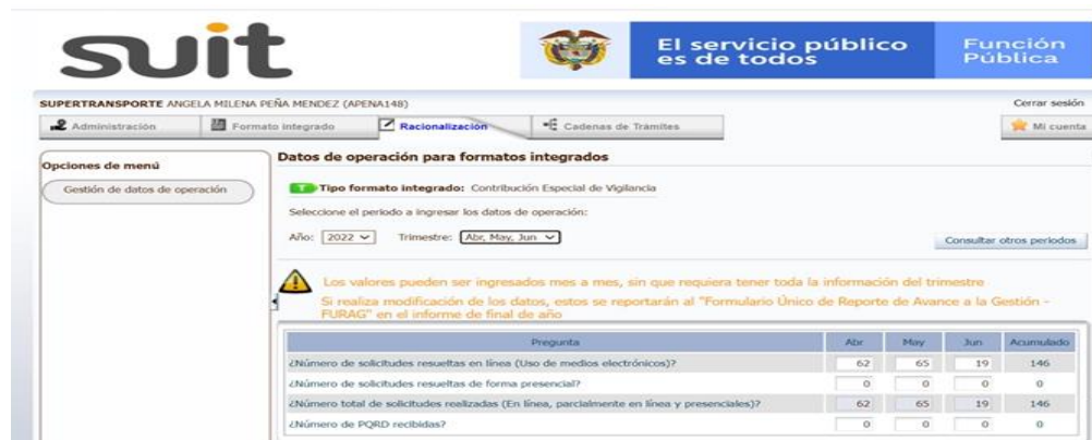
Imagen No.2: registro trámite Contribución Especial de Vigilancia.

Se realizó verificación en la plataforma SUIT de los trámites registrados por la entidad los cuales correspondieron a 146 operaciones que coinciden con lo reportado en los soportes cargados en la carpeta compartida Share Point – Gestión de datos trámites – Contribución Especial de