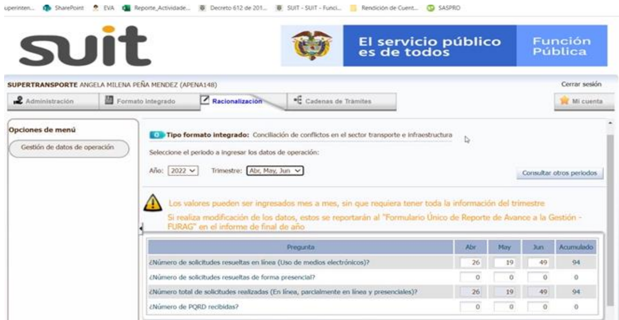
Imagen 6: Registro SUIT - Conciliación de conflictos en el sector transporte e infraestructura.

La dependencia responsable del trámite es el Centro de Conciliación arbitraje y amigable composición de la Superintendencia de Transporte, se evidenciaron para el mes de abril 26 operaciones, para mayo 19 operaciones, y para junio 49 operaciones, lo que coincide con la información reportada por la Oficina Asesora de Planeación en la carpeta Share Point – repositorio de evidencias – a. direccionamiento estratégico- b. AUDITORÍAS- B2 SEGUIMIENTO- 2. SUIT – Segundo trimestre, en la matriz denominada "REPORTE DATOS DE OPERACIÓN ABRIL, MAYO, JUNIO 2022 CENTRO DE CONCILIACIÓN. xlsx"