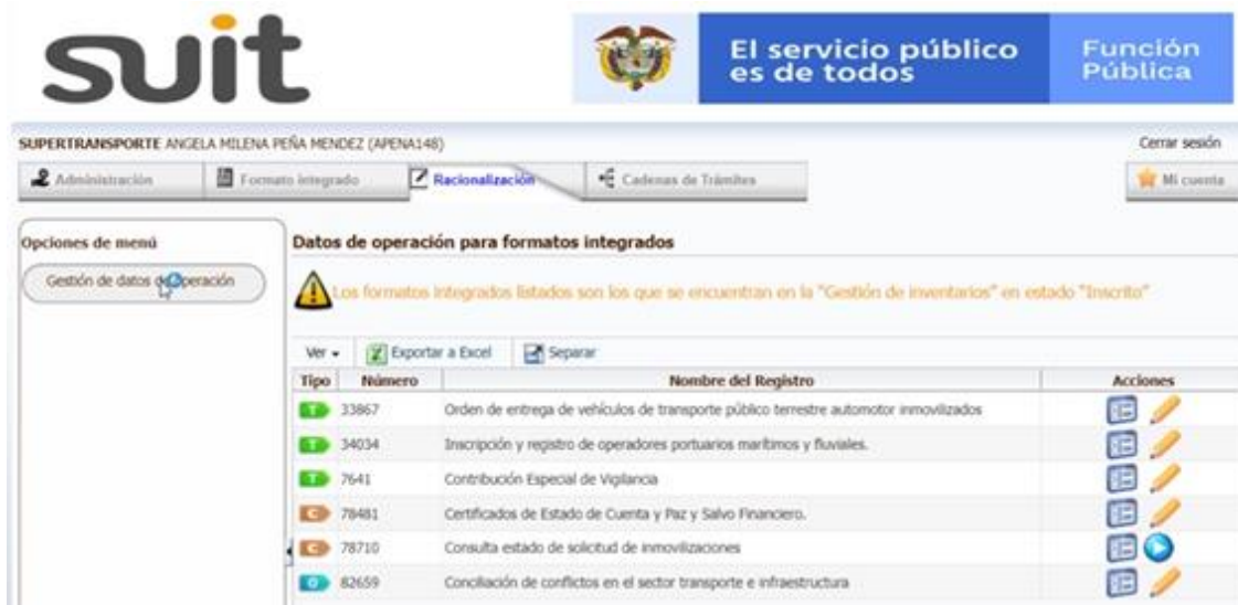
Imagen No. 1: Trámites inscritos en la plataforma SUIT