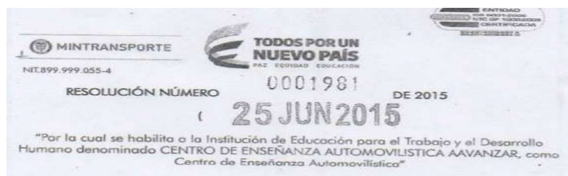
Imagen No. 1. Resolución No.1981 del 25 de junio de 2015, otorgada por el Ministerio de Transporte a AAVANZAR 19

Analizados los documentos allegados por AAVANZAR , se evidenció que aportó la Resolución No. 1981 del 25 de junio de 2015, mediante la cual el Ministerio de Transporte lo habilitó para prestar sus servicios como Centro de Enseñanza Automovilística, únicamente en la Carrera 38 No. 9-45/63 Oficina 628, de la ciudad de Bogotá.