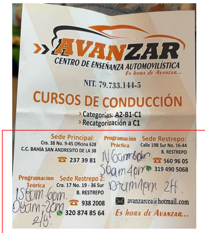
Imagen No. 4. Volante Publicitario de AAVANZAR 22

De la anterior situación, se evidencia una posible irregularidad, ya que tal y como fue señalado en las Resoluciones aportadas por AAVANZAR , el Investigado se encuentra habilitado únicamente para prestar sus servicios en la Carrera 38 No. 9-45 Oficina 628 de la ciudad de Bogotá y no en las otras dos direcciones enunciadas en el volante publicitario.