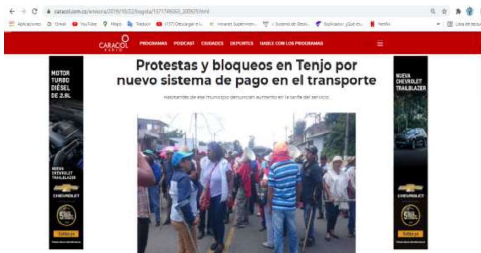
Imagen 10.

"Por la cual se abre una investigación administrativa mediante la formulación de pliego de cargos"