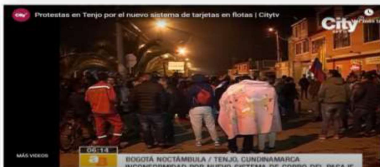
Imagen 11. extraída del portal web de la página del periódico El Tiempo - 001c2454cbaf1912bcd449a28ec1183b65b8db8bcd7f670724c419ccdb18c5f8

Que de la evaluación y análisis de los documentos físicos y electrónicos que conforman los diferentes elementos materiales probatorios allegados a esta entidad por parte de ciudadanos y medios nacionales, se pudo evidenciar a partir de un claro indicio que TRANSPORTES TISQUESUSA S.A ha incurrido con su actuar en la conducta de alteración del servicio de transporte de pasajeros por carretera, cometiendo irregularidades que afectan el deber ser de un servicio público esencial como lo es el servicio público de transporte.