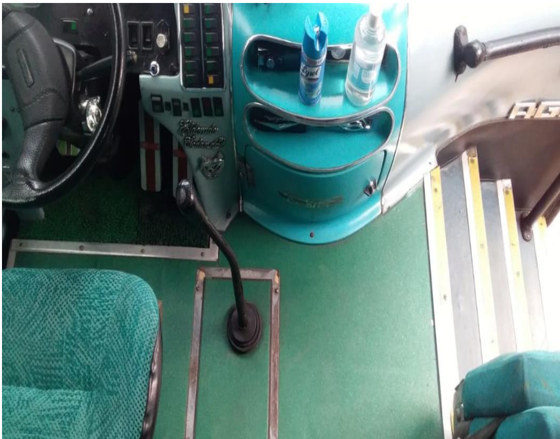
Imagen No. 4. Tomada de archivo llamado "protocolos.rar". Radicado No. 20205321180722 del 13/11/2020

Que esta Superintendencia de Transporte, pudo corroborar que al interior de los vehículos pertenecientes a la Investigada, no se encuentran elementos que incumplen las medidas impartidas por el Gobierno Nacional, en relación con los protocolos de bioseguridad.