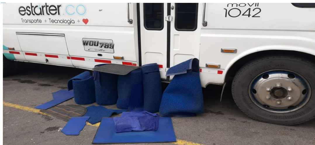
Imagen No. 1. Tomada de archivo llamado "protocolos.rar". Radicado No. 20205321180722 del 13/11/2020

Durante la visita administrativa llevada a cabo el 12 de noviembre de 2020, la Superintendencia de Transporte logró evidenciar que los vehículos pertenecientes a la empresa, le habían sido retirado los elementos susceptibles de contaminación, veamos: