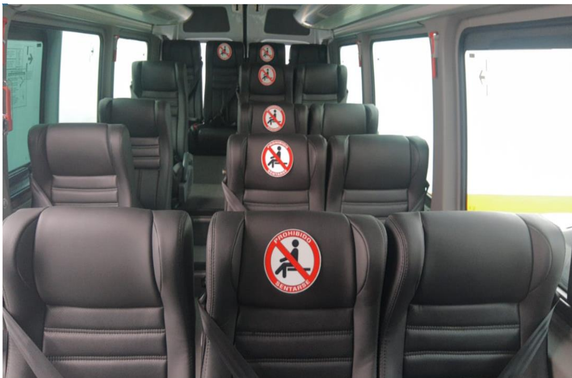
Imagen No. 5. Tomada de archivo llamado "protocolos.rar". Radicado No. 20205321180722 del 13/11/2020

Que esta Superintendencia de Transporte, pudo corroborar que al interior de los vehículos pertenecientes a la Investigada, no se encuentran elementos que incumplen las medidas impartidas por el Gobierno Nacional, en relación con los protocolos de bioseguridad.