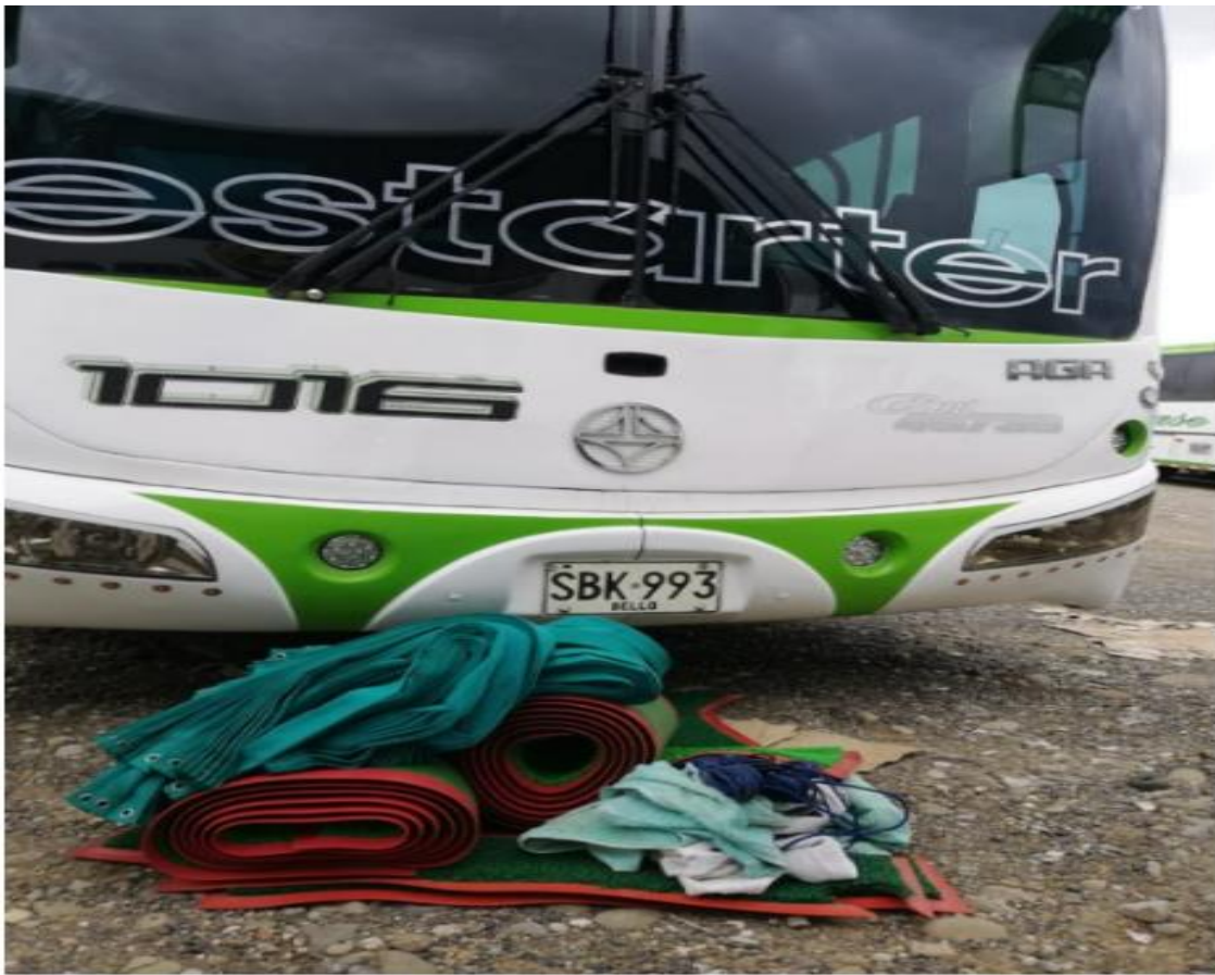
Imagen No. 3. Tomada de archivo llamado "protocolos.rar". Radicado No. 20205321180722 del 13/11/2020