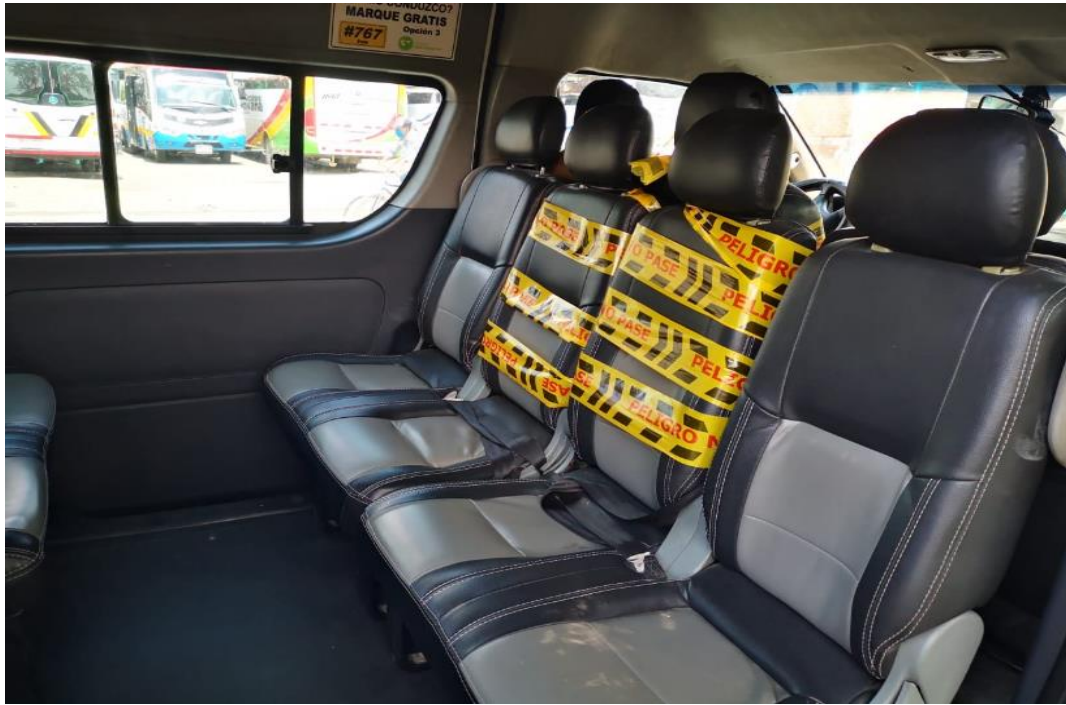
Imagen No. 7. Captura de pantalla, tomada al video de archivo llamado "protocolos.rar". Radicado No. 20205321180722 del 13/11/2020 del interior del vehículo en el cual muestran el proceso de desinfección del mismo