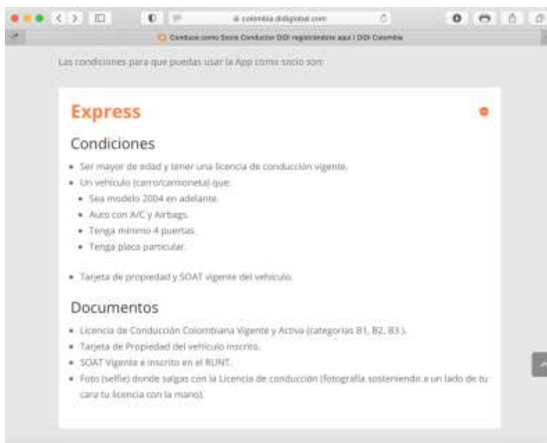
Imagen 6. Captura “Condiciones para que puedas usar la App como socio”

Igualmente, se evidencian condiciones como: Ser mayor de edad y tener una licencia de conducción vigente, Un vehículo (carro/camioneta) que: Sea modelo 2004 en adelante, Auto con A/C y Airbags, Tenga mínimo 4 puertas y Tenga placa particular , entre otros.