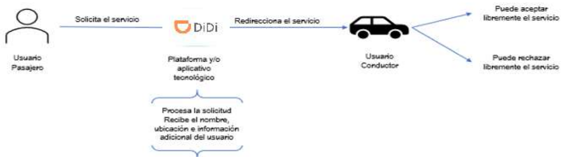
Imagen 3. Gráfico del proceso de solicitud del servicio.

Igualmente, se evidencia que tanto el Usuario como el Socio pueden, a través del aplicativo tecnológico, aceptar o rechazar las solicitudes de servicio que reciban. Lo anterior, teniendo en cuenta que la cancelación de los servicios puede generar penalidades 59 .