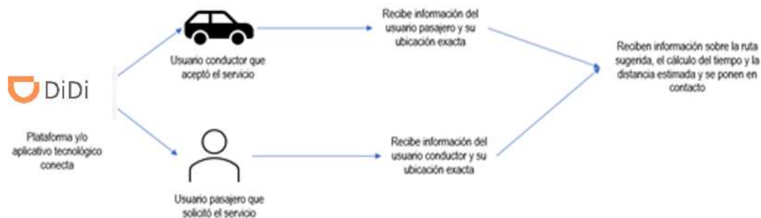
Imagen 5. Gráfico de la operación desarrollada.

“Por la cual se abre una investigación administrativa mediante la formulación de pliego de cargos”