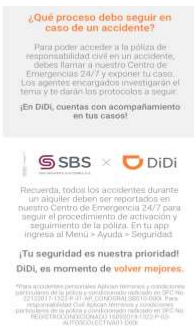
Imagen 8. Captura “Captura promoción seguro”

En conclusión, se tiene que ASESORIAS CC , quién presuntamente actúa en calidad de intermediario, facilitador y portal de contacto, presuntamente está facilitando, promoviendo y provocando la trasgresión sistemática de las normas de transporte, al permitir la utilización de herramientas tecnológicas para el desarrollo de la prestación del servicio público de transporte que no cumple con los requisitos legales dispuestos para ello.