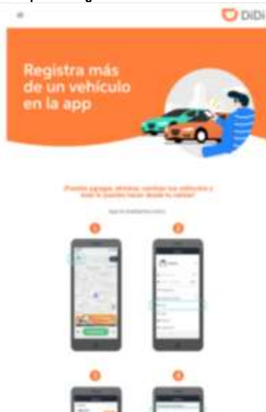
Imagen 7. Captura “Registra más de un vehículo en la app”

Así, se tiene que una vez el Socio envía todos los documentos a través del aplicativo tecnológico o los canales dispuestos para tal fin, y la Investigada identifica que los mismos dan cumplimiento al procedimiento de registro aprobado por éste , es aprobada la solicitud del respectivo Socio, aprobación que se materializa con su activación en dicho aplicativo tecnológico, para que a partir ese momento pueda prestar sus servicios a través del mismo.