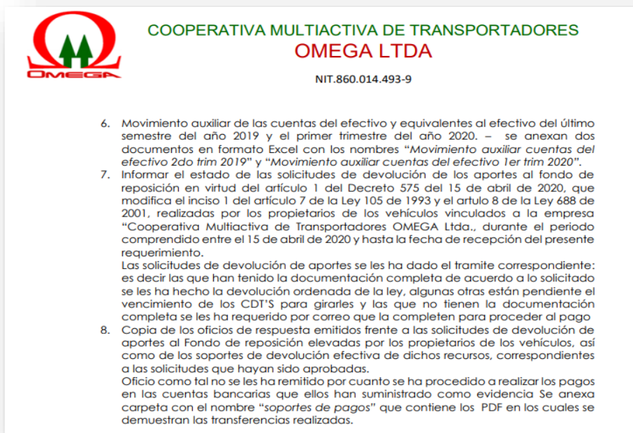
Imagen 1. Extraída del Radicado de entrada No. 20205320738652 del 08/09/2020.

los propietarios de dichos recursos y (ii) no suministró de manera completa la información que le fue legalmente solicitada por parte de la autoridad competente bajo el oficio de salida No. 20208700385301, en la medida en que su respuesta no atendió de manera satisfactoria lo solicitado, teniendo en cuenta que no allegó la información y evidencia detallada de los ítems 7 y 8 requeridos en el citado oficio de salida por la Dirección de Investigaciones de Tránsito y Transporte.