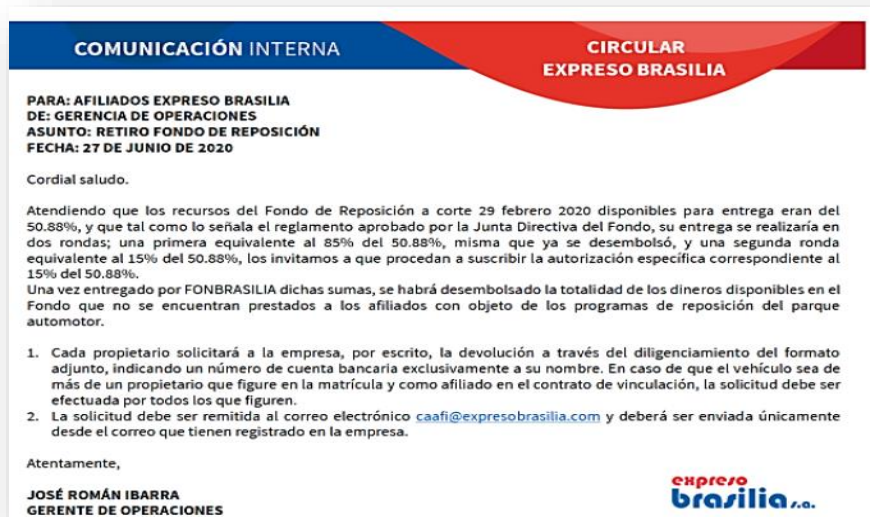
Imagen 4. Extraída del Radicado de entrada No. 20205320508122 – Carpeta Pantallazos comunicados afiliados.

Lo anterior máxime cuando las disposiciones previamente citadas y pese a que la investigada manifiesta que fueron decisiones tomadas de manera conjunta, no se logra evidenciar soporte alguno de ello y por el contrario conforme las quejas allegadas a esta superintendencia, con el material expuesto se evidencia que la investigada no permitió la devolución de hasta el 85% de los recursos aportados a los programas periódicos de reposición que corresponden a los propietarios de los vehículos, en el marco de la declaratoria de estado de Emergencia Económica, Social, y Ecológica, presuntamente imponiendo de manera unilateral un formato condicionado para efectuar la devolución de dichos dineros y creando requisitos o condiciones no previstas en la normatividad aplicable para proceder con el pago correspondiente.