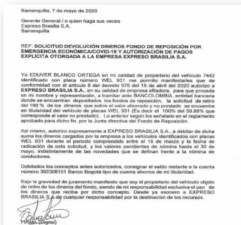
Imagen 5. Extraída del Radicado de entrada No. 20205320508122 – Carpeta Solicitudes afiliados.

"Por la cual se abre una investigación administrativa mediante la formulación de pliego de cargos"