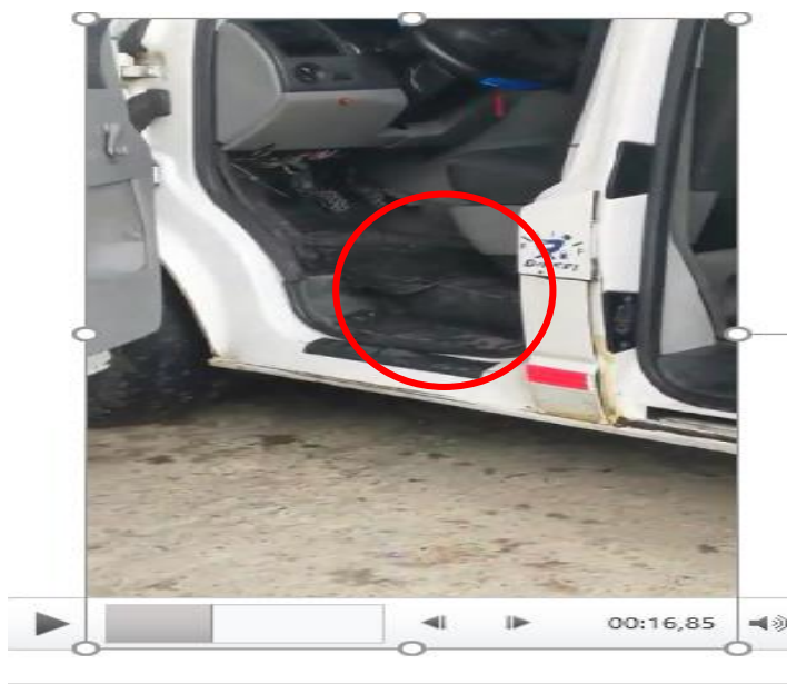
Imagen No 3. Captura de pantalla video No. 2 de la documentación allegada a través de radicado No. 20205320794982 18/09/2020

“Por la cual se abre una investigación administrativa mediante la formulación de pliego de cargos”