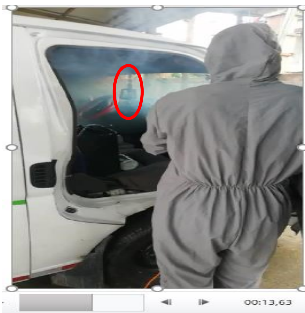
Imagen No 2. Captura de pantalla video No. 2 de la documentación allegada a través de radicado No. 20205320794982 18/09/2020