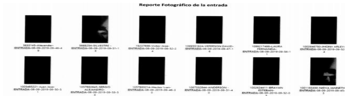
Imagen No. 2. Fotografías que fueron tomadas a los aprendices y al instructor el día 08 de septiembre de 2019, al salir de la sesión de “MTPML2” 21 .

“Por la cual se abre una investigación administrativa mediante la formulación de pliego de cargos contra el Centro de Enseñanza Automovilística LOS COCHES LA PROVINCIA ”