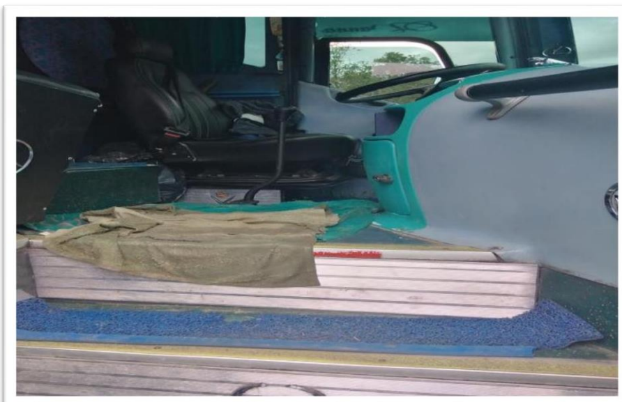
Imagen No. 5. Fotografía tomada de las escaleras de ingreso al vehículo identificado con placas XGC 652

Ahora bien, del material probatorio recabado es posible concluir que la Investigada presuntamente presta servicio público de transporte especial sin realizar la respectiva limpieza y desinfección del interior del vehículo, y sin cumplir con los protocolos de aseo del mismo. A continuación, se relaciona el registro: