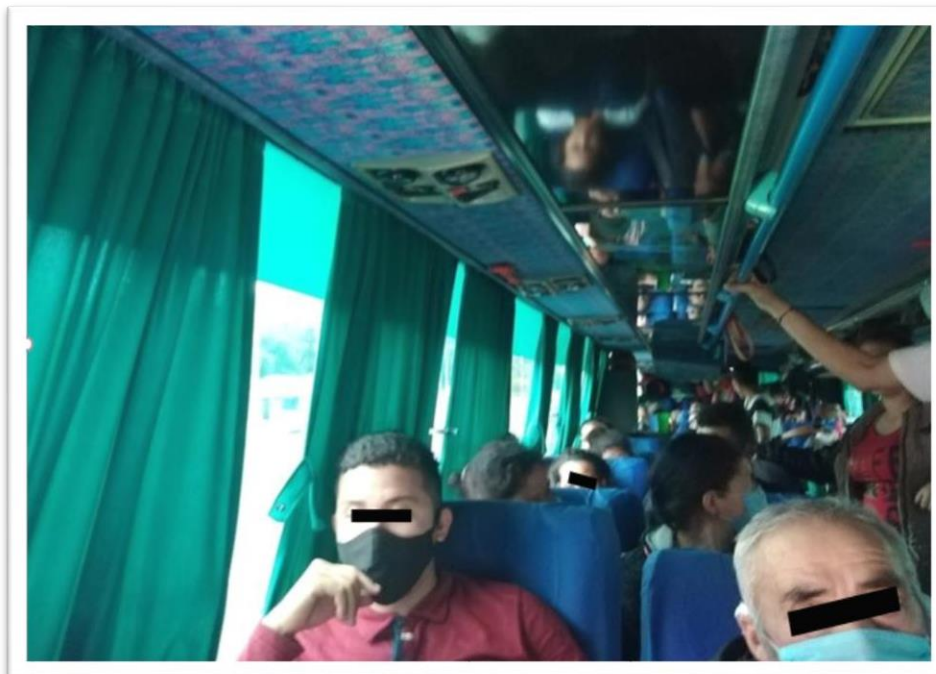
Imagen No. 4. Fotografía tomada del interior del vehículo identificado con placas XGC 652

Por lo anterior se tiene que la empresa de TRANSPORTE LIBERTURS S.A.S presuntamente infringe lo dispuesto en literal d., del numeral 3.1, del anexo técnico incorporado a la Resolución 677 del 2020, al no cumplir con lo dispuesto en los protocolos de bioseguridad ordenados por el Gobierno Nacional, en la medida en que presuntamente no asegura que exista la distancia mínima requerida entre uno y otro pasajero de un (1) metro, al interior del vehículo, e incluso se permite el tránsito de pasajeros de pie, lo que reduce aún más, la distancia existente.