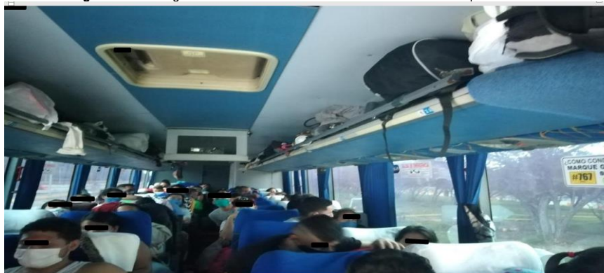
Imagen No. 3. Fotografía tomada del interior del vehículo identificado con placas XVX 061

De conformidad con el registro fotográfico obrante en el informe referido es posible evidenciar que al interior del vehículo, todos los puestos disponibles se encuentran completamente ocupados por los pasajeros. A continuación, se relaciona el registro fotográfico en el cual es posible identificar lo señalado: