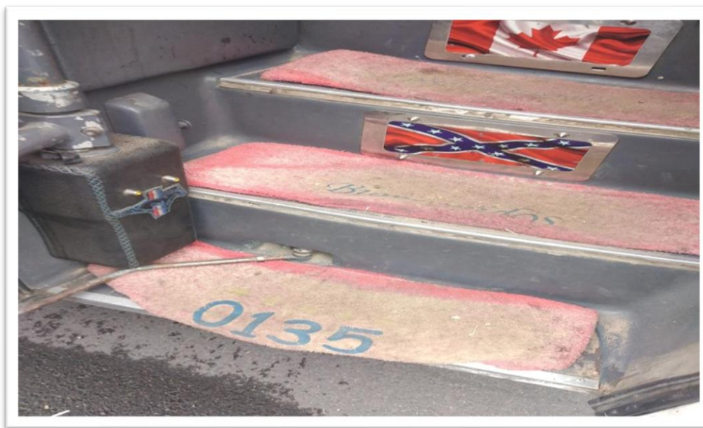
Imagen No. 5. Fotografía tomada de las escaleras de ingreso al vehículo identificado con placas XVX 061

Que por las imágenes anteriormente expuestas, se logra verificar que la COOPERATIVA DE TRANSPORTES ESPECIALES DEL ORIENTE presuntamente infringe lo dispuesto en numeral 3.1 del anexo técnico incorporado a la Resolución 677 del 2020, al no cumplir con lo dispuesto en los protocolos de bioseguridad ordenados por el Gobierno Nacional, en la medida en que presuntamente (i) no realiza el aseo y desinfección del vehículo por cuanto, en el mismo, se evidencia suciedad.