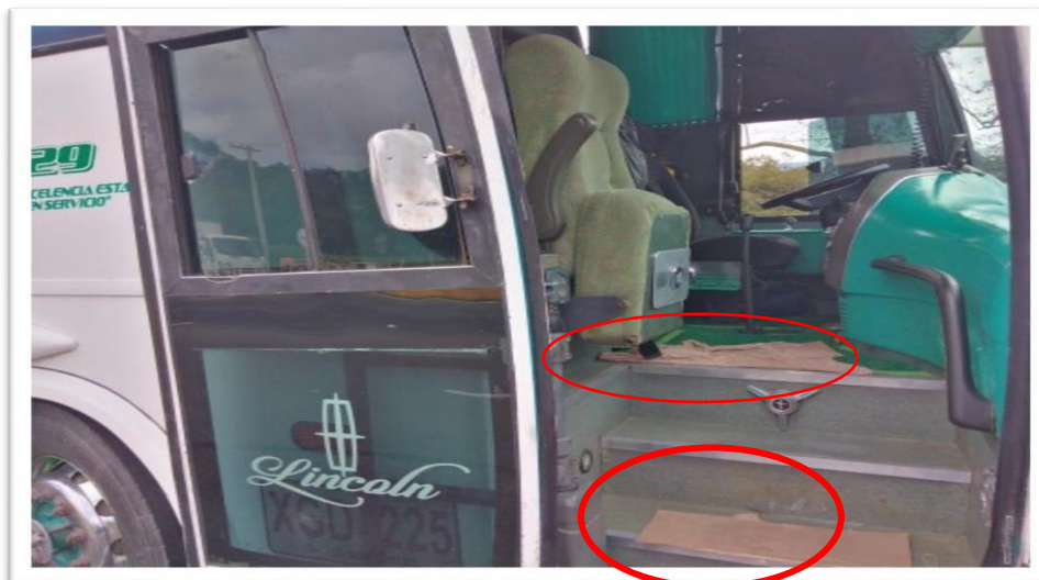
Imagen No. 6 Registro fotográfico de las escaleras de acceso al vehículo de placas XGD 225

Ahora bien, del material probatorio recabado es posible concluir que la Investigada presuntamente presta servicio público de transporte especial sin realizar la respectiva limpieza y desinfección del interior del vehículo, y sin cumplir con los protocolos de aseo del mismo.