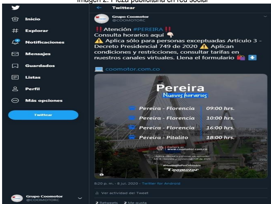
Imagen 2. Pieza publicitaria en red social