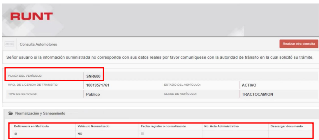
Imagen No. 1. Anotación del Registro Único Nacional de Transito (RUNT) sobre la normalización y saneamiento del vehículo SNR680 11 .

Como se puede observar, con solo realizar la consulta usando la placa del vehículo en la página web del RUNT, de los registros del vehículo de placa SNR680, se podía identificar el estado del mismo. De la misma manera, consultando la plataforma RNDC, se logra evidenciar que el vehículo cuenta con la anotación “REGISTRO INICIAL CON OMISIONES” y, aun así, el investigado incumpliendo de manera clara con sus deberes, expidió veinticinco (25) manifiestos electrónicos de carga al vehículo referido para la prestación del servicio público de transporte de carga durante los meses de enero y octubre de 2020–fecha en la cual ya se había expedido la circular del Ministerio de Transporte del 30 de enero de 2020, como se evidencia a continuación: